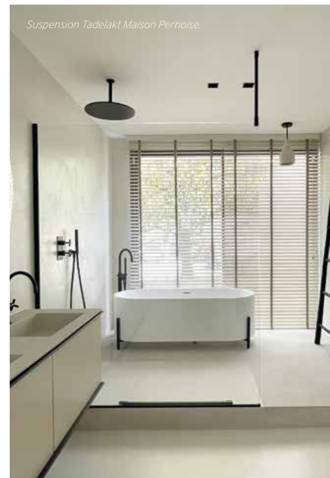
Suspension Tadelakt Maison Pernoise.