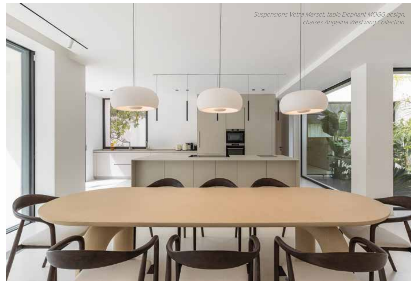
Suspensions Vetra Marset, table Elephant MOGG design, chaises Angelina Westwing Collection.