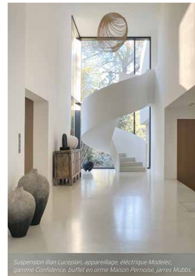
Suspension Illan Luceplan, appareillage, électrique Modelec, gamme Confidence, buffet en orme Maison Pernoise, jarres Mubbs.