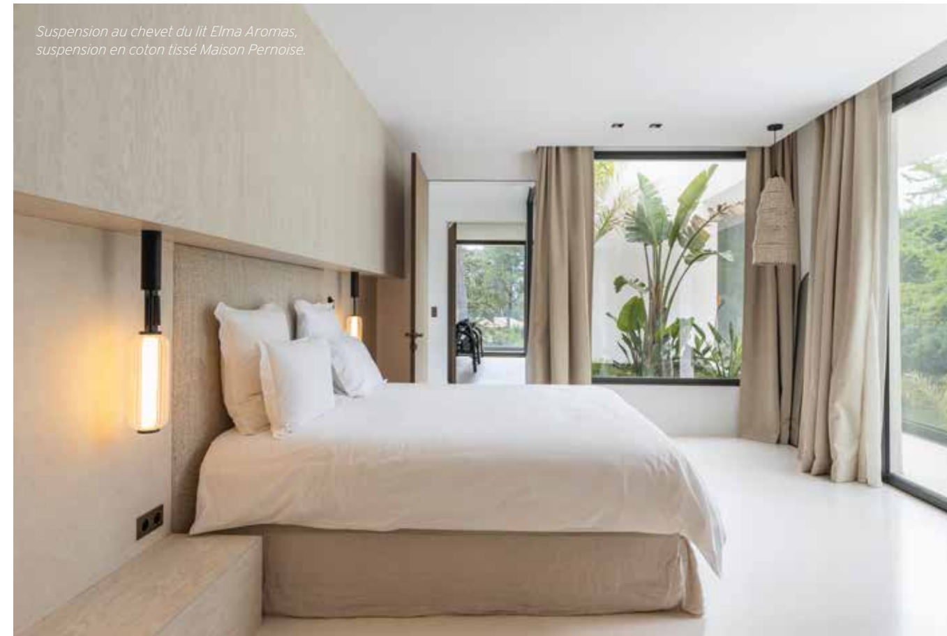
Suspension au chevet du lit Elma Aromas, suspension en coton tissé Maison Pernoise.